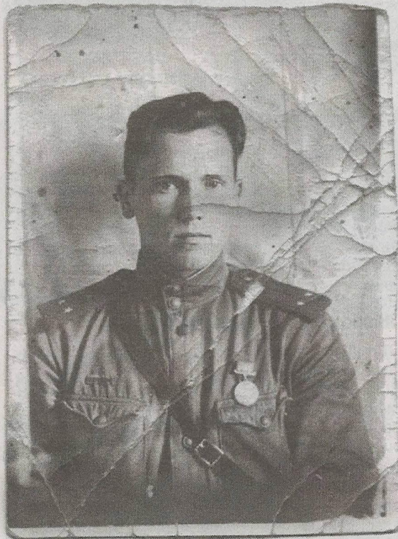
Старая фотография лежала в книге, переданной библиотеке.

Случайно найдя старую фотографию военной поры в одной из книг, которые обычно за ненадобностью сдают в свою районную библиотеку жители Медведевского района, ее сотрудница узнала историю фронтовика, изображенного на снимке. Теперь она разыскивает его родных.